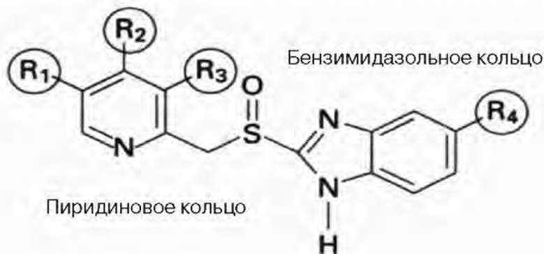
Рисунок 2 Химическая структура ИПП